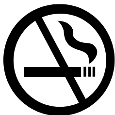
Cartello di divieto di fumo

Fino a qualche anno fa, infatti, non esisteva, se non in pochissimi individui, la certezza, meglio la consapevolezza culturale delle conseguenze nocive del fumo, attivo e passivo. Si alzavano le spalle e si giravano i tacchi di fronte al fastidioso interlocutore che consigliava "Smetti, ci guada-